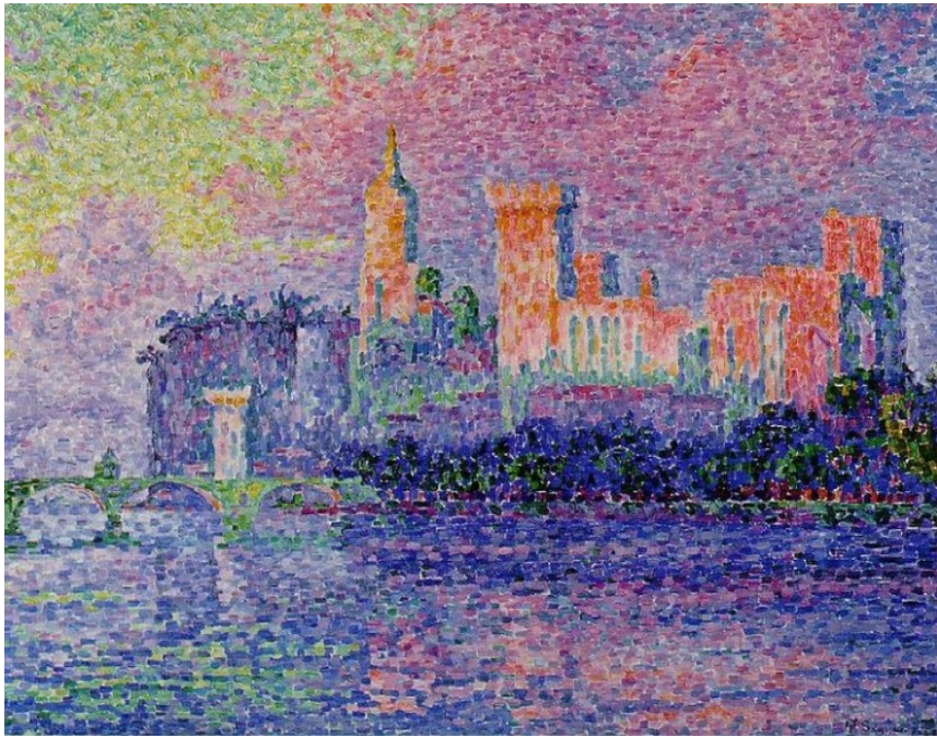
시나크, <아비뇰의 교황청>