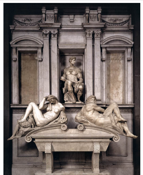
미켈란젤로, <줄리아노 데 메디치>, 메디치 묘소