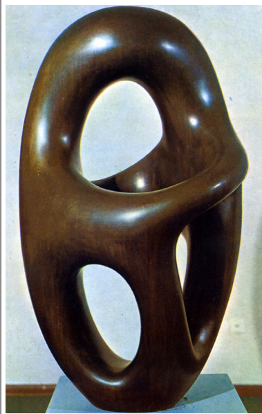
아르프, <프톨레미 I>