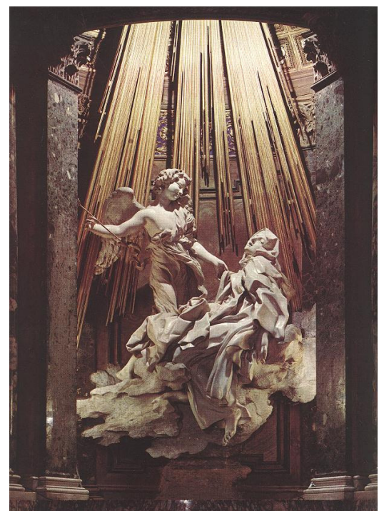
베르니니, <성 테레사의 범열>, 코르나로 예배당