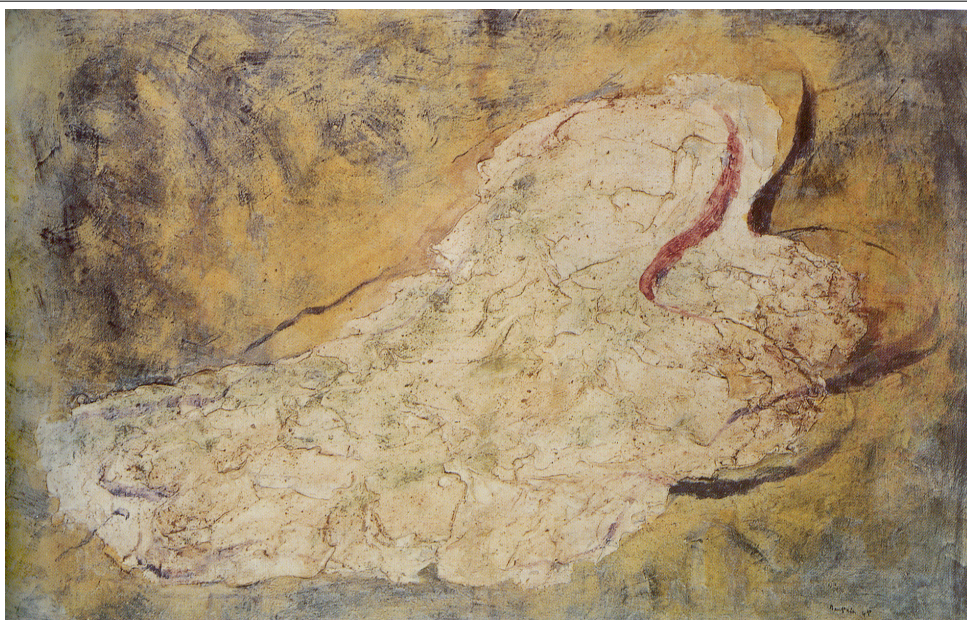
포트리에, <유태인 여인>