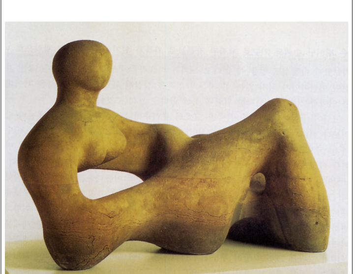
무어, <기대 누운 인물>